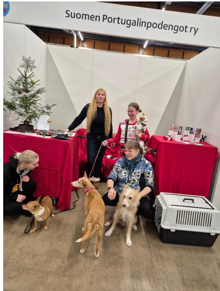
Podengoständi Koiramessuilla 6.-7.12–2025

Erilaisten tapahtumien lisäksi yhdistyksellä on ollut vuosien varrella runsaasti muutakin toimintaa. Vuoteen 2015 asti yhdistys järjesti sääntömääräiset vuosikokoukset kaksi kertaa vuodessa, keväällä ja syksyllä. Sääntöuudistuksen myötä kahdesta vuosittaisesta kokouksesta siirryttiin yhteen kokoukseen, joka pidetään joka vuosi tammi-toukokuun aikana. Harrastamiseen yhdistys on kannustanut jäseniään erilaisten vuosikilpailujen muodossa. Tästä esimerkkinä parhaiten näyttelyssä menestyneiden palkitseminen Vuoden podengo- ja maastokisoissa parhaiten pärjänneiden palkitseminen Vuoden metsästäjä -diplomilla. Kilpailujen määrä on