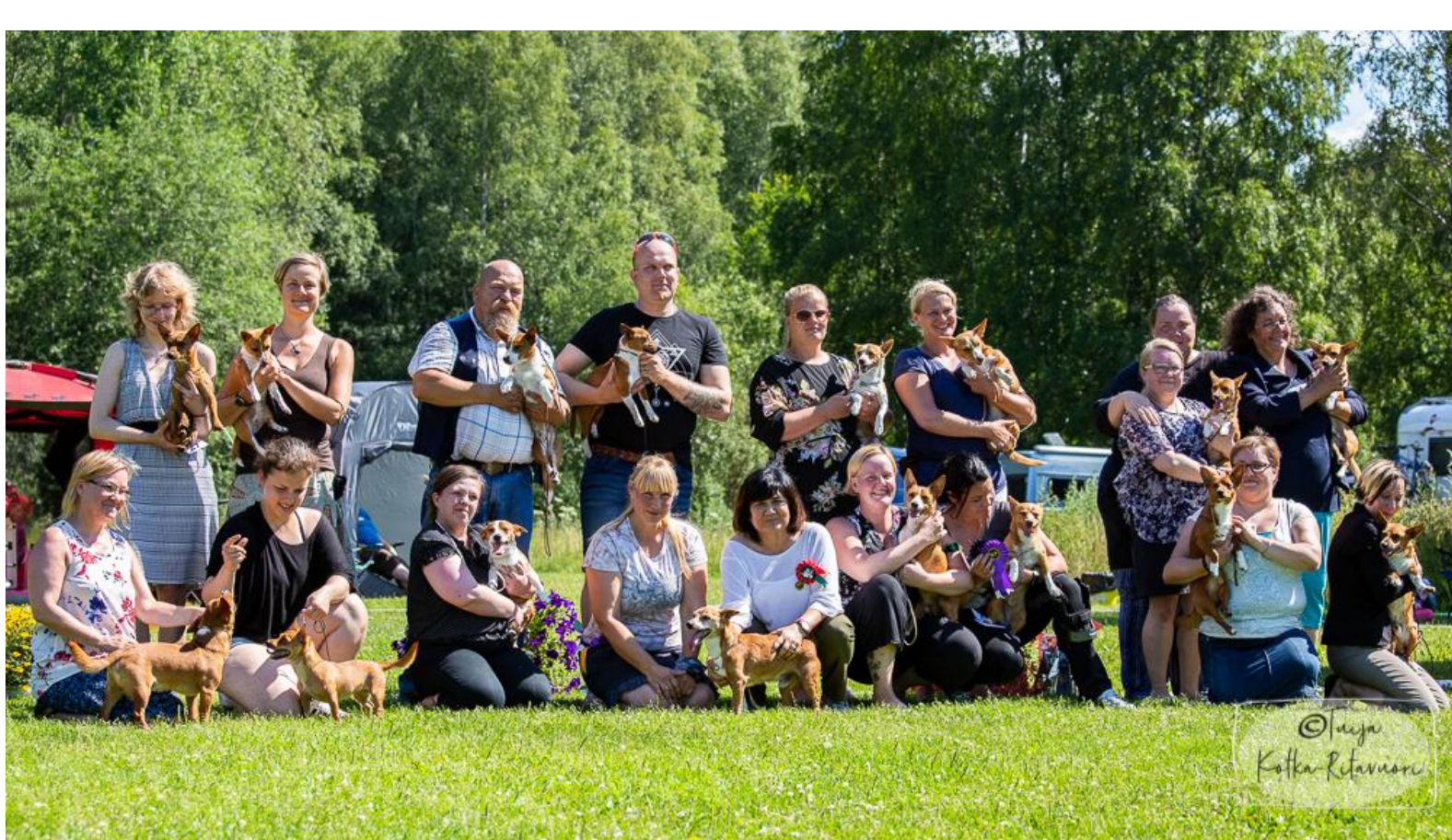
Erikoisnäyttely Hyvinkäällä 2018

Seuraavat omat erkkarit järjestettiin Pöytyällä 25.8.2019 yhteistyössä Suomen Faaraokoirat ry:n erikoisnäyttelyn kanssa. Tuomarina toimi Pedro Sanches Delerue Portugalista. Koiria arvosteltiin huikeat 104 kappaletta. Näyttelyn kauden parhaaksi podengoksi valittiin toistamiseen pieni karkeakarvainen Smaughterer's Cristal.