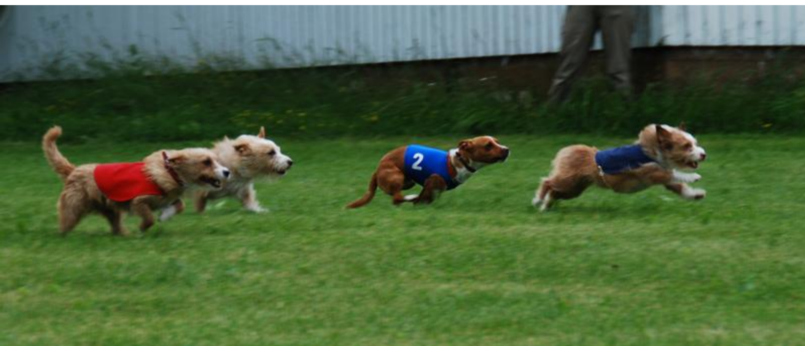
Kesäpäivät Hämeenlinnassa 2010

Messilän leirintäalueella järjestettiin 8.7. vuoden 2017 kesäpäivät. Paikalla