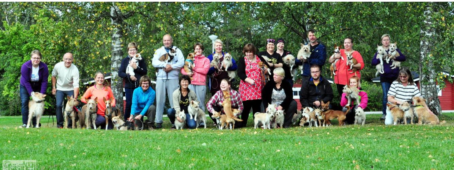
Kesäpäivät Nokiolla 2016

Keräsin vanhoista toimintakertomuksista melko kattavan listan kesäpäivistä ja niiden pitopaikoista ympäri Suomea. Vuosien 1998–2001 kesäpäivistä ei toimintakertomuksissa kerrottu. Sen sijaan löysin tiedon, että vuonna 2001 järjestettiin Porin KV näyttelyssä 28.7.